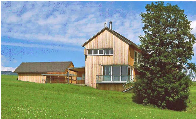
Neue Architektur aus der historischen Typologie generiert