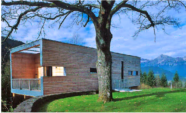
Neue Architektur in formal reduzierter Hülle

Dazu ein weiteres Zitat von Geramb (*Steirische Landbaufibel, 1948): „Bodenständige, handwerklich überlieferte Bauformen und Herstellungsarten sollen überall bevorzugt werden. Das bedeutet aber nicht gedankenlose Nachahmung alter Formen und Verfahren, im Gegenteil, es soll unter Berücksichtigung von Alterproblemen und Altbewährtem Neues gestaltet werden, das den Forderungen und der Art des Volkes, der Zeit und des Ortes entspricht.....“.*