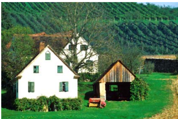
Historisches Gehöft

Neben Berichten über die baukulturelle Entwicklung und Aktivitäten in den Regionen, in der Obersteiermark, in den Naturparks „Südsteirisches Weinland“ und „Almenland“ wurde aufgezeigt, dass sich die Bauforschung in der Vergangenheit meist auf das (insbesondere bäuerliche) Wohnhaus bezogen hat, wir heute aber mit einer Vielzahl an Themen, wie die rasante Veränderung der Ortsränder durch monotone Gewerbebeparks, unmaßstäbliche Tourismusbauten in Kulturlandschaften, Landschaftsfraß durch Schlafghettos in den Speckgürteln der Städte, landwirtschaftliche Industriebauten im Freiland, konfrontiert sind.