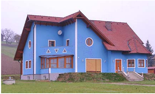
Gestalterischer Mix

Am Beispiel des Wohnhauses wurde die Entwicklung in der Baukultur von der Hausforschung des Viktor Geramb bis zur heutigen Zeit umrissen: Einerseits haben sich Besiedlungsformen stark verändert (Stichwort Zersiedelung), andererseits bietet heute die Technik und der Markt eine unendliche Vielzahl an Möglichkeiten und Anreizen der individuellen Gestaltung, was sich nicht immer positiv auf die baukulturelle Entwicklung auswirkt.