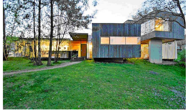
Neue Architektur im Gleichklang mit der Natur