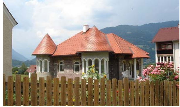
Bauen im „Cinderellastil“